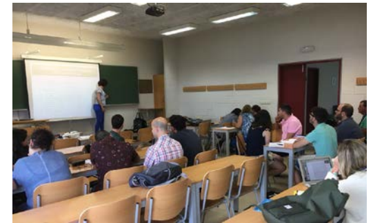
4º Escuela de Doctorado