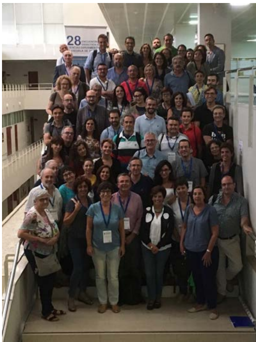
Foto recordatoria de la Asamblea de APICE 2018