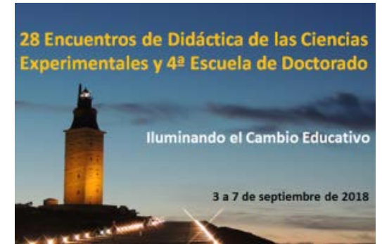
Cartel anunciador de los 28 edce